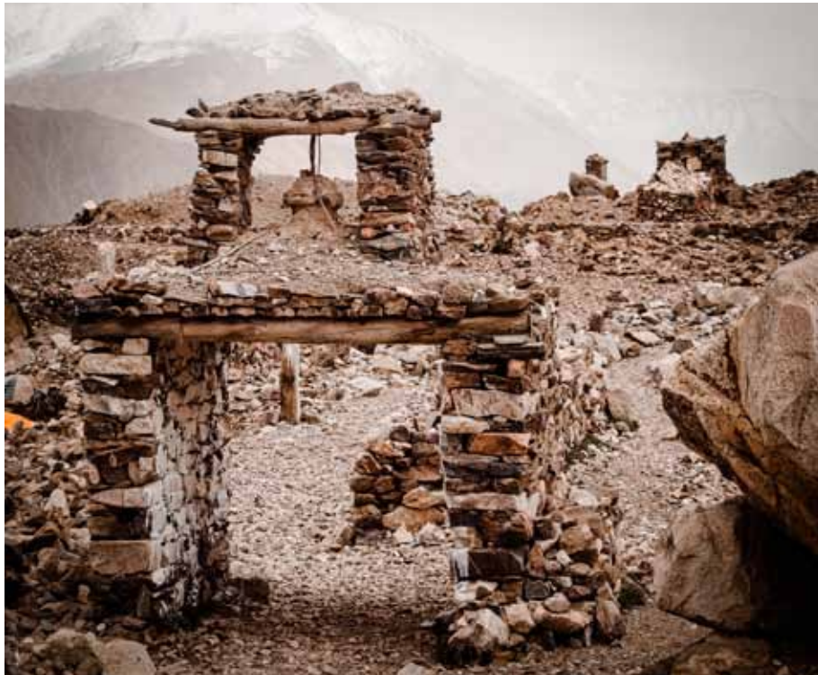
14., 15. & 16. NAKO (I, II & III)

Nako, kaum 20 Kilometer von der Grenze zu Tibet entfernt ist nur über eine schwindelerregende Strasse zu erreichen. Im Winter fällt die Temperatur hier auf bis zu 50 Minusgrade.